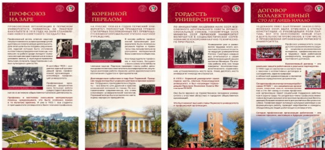
ВИД ВСЕГО ИНФОРМАЦИОННОГО КОМПЛЕКСА